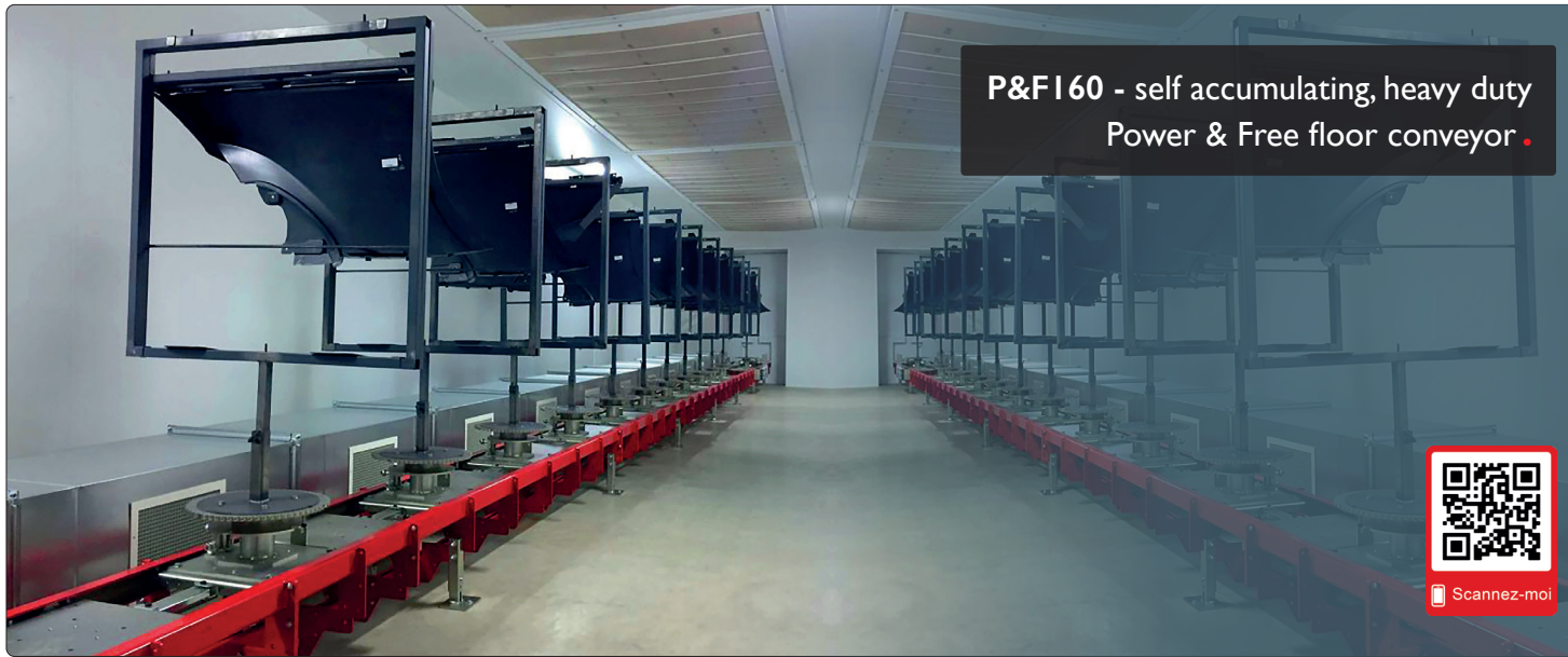
P&F160 - self accumulating, heavy duty Power & Free floor conveyor .